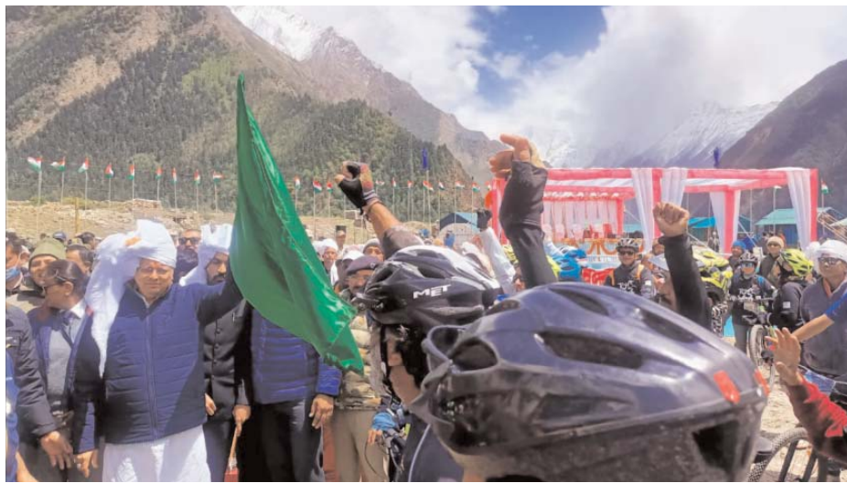
माउन्टेन साइकिल रैली का शुभारंभ करते सीएम।

वीर अर्जुन संवाददाता देहरादून, । मुख्यमंत्री पुष्कर सिंह धामी ने बुधवार को आजादी का अमृत महोत्सव कार्यक्रम के तहत 10500 फीट की ऊंचाई पर स्थित गुंजी धारचूला में आयोजित साहसिक एमटीबी साइकिल रैली दूर द कैलाश को हरी झण्डी दिखाकर ज्यूलिकींग और नभोडांग के लिए रवाना किया। इस दौरान मुख्यमंत्री ने कुटी और यांगती नदी में राफ्टिंग करने वाले दल को भी रवाना किया। मुख्यमंत्री ने माउन्टेन साइकिल रैली में प्रतिभाग कर रहे विभिन्न राज्यों से आए सभी प्रतिभागियों का स्वागत करते हुए कहा कि इससे प्रतिभागियों को उत्तराखण्ड के नैसर्गिक प्राकृतिक सौन्दर्य एवं संस्कृति से परिचित होने का अवसर प्राप्त होगा। उन्होंने कहा कि इस प्रकार के कार्यक्रमों का आयोजन बेहद सराहनीय कदम है। इस कार्यक्रम के माध्यम से अन्य राज्यों से आए हुए लोगों को भी प्रदेश और सीमान्त क्षेत्र को जानने