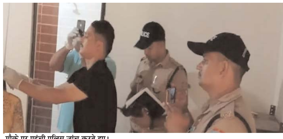
मौके पर पहुंची पुलिस जांच करते हुए।

वीर अर्जुन संवाददाता हरिद्वार, । सिडकुल थाना क्षेत्र में स्थित आश्रय गृह में एक किशोरी ने फांसी लगा आत्महत्या कर ली। किशोरी ने मौत को गले क्यों लगाया, उसका पता नहीं चल पाया है। पुलिस ने शव का पंचनामा भर पोस्टमार्टम के लिए भिजवा दिया है। रावली महदुद सिडकुल स्थित आश्रय गृह में बुधवार दोपहर उस समय हडकंप मच गया, जब आश्रय गृह की एक कमरे में एक किशोरी का शव फंदे से झूलता हुआ मिला।