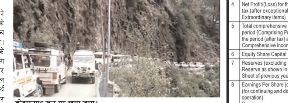
केदारनाथ रूट पर लगा जाम।

वीर अर्जुन संवाददाता रुद्रप्रयाग, । केदारनाथ धाम आने वाले तीर्थयात्रियों को धाम जाने के लिए सोनप्रयाग से गौरीकुंड के बीच दूरी तक जाम में फंसना पड़ रहा है। पांच किमी के सफर को तय करने के लिए यात्रियों को तीन से चार घंटे लग रहे हैं। ऐसे में तीर्थ यात्री समय पर केदारनाथ धाम के लिए नहीं निकल पा रहे हैं। केदारनाथ आने वाले तीर्थ यात्रियों के वाहन सोनप्रयाग और सीतापुर में पार्क हो जाते हैं। सोनप्रयाग से यात्रियों को प्रशासन की शटल सेवा से गौरीकुंड तक जाना पड़ता है। सोनप्रयाग से गौरीकुंड की दूरी पांच किमी है, लेकिन इस पांच किमी के सफर को तय करने में घंटों का समय लग रहा है। सोनप्रयाग से गौरीकुंड के बीच शटल सेवा में दो सौ से अधिक वाहनों का संचालन हो